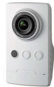
眠りSCAN eye 対応カメラ

【型番】PoE AXIS M1065L:オープン価格 / Wi-Fi AXIS 1065LW:オープン価格【サイズ】106mmx60mmx37mm【重量】134g ◎三脚ネジ(カメラネジ1/4インチ)に対応、さまざまな市販カメラ固定器具が利用でき、用途に合わせた場所に設置できます。